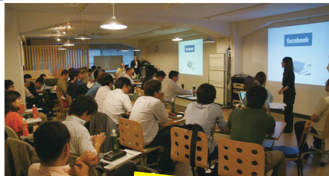
前回のfacebook講座の様子

facebookページを立ち上げたものの、ビジネスになかなか繋がらない。そんな方に各業界のfacebook成功者の実体験を聞きながら、ビジネスへの活用方法について、方向性とヒントをお伝えしたいと思います。